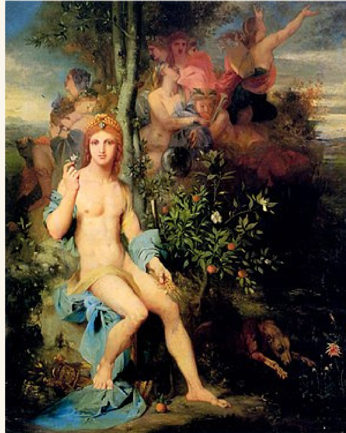
Apolo y las nueve musas de Gustave Moreau