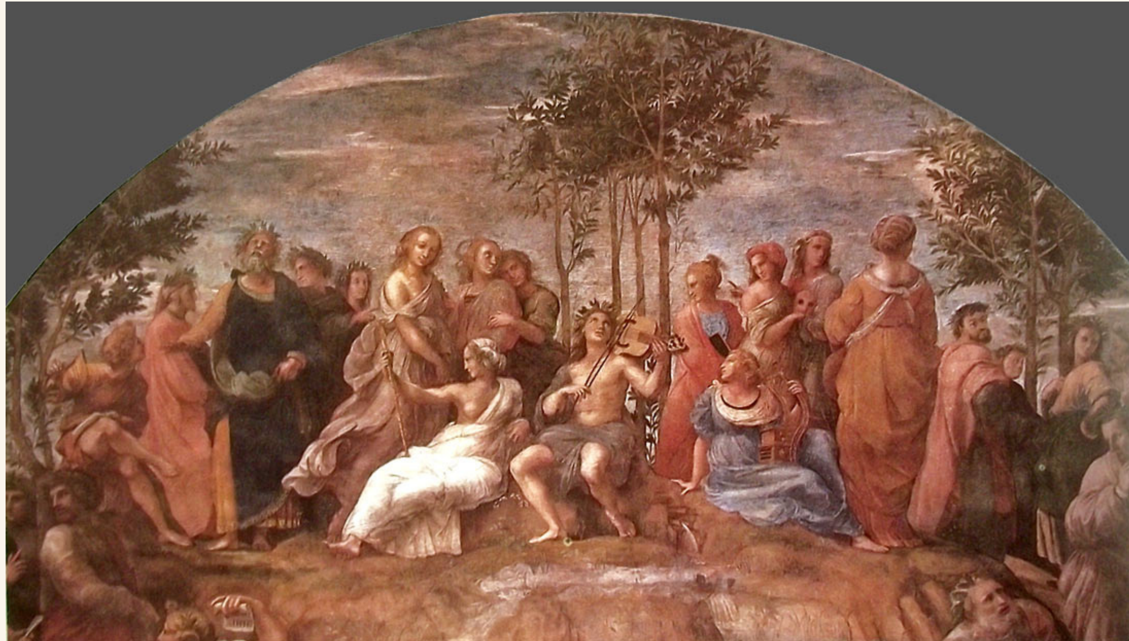
Apolo en el Parnaso de Rafael Sanzio