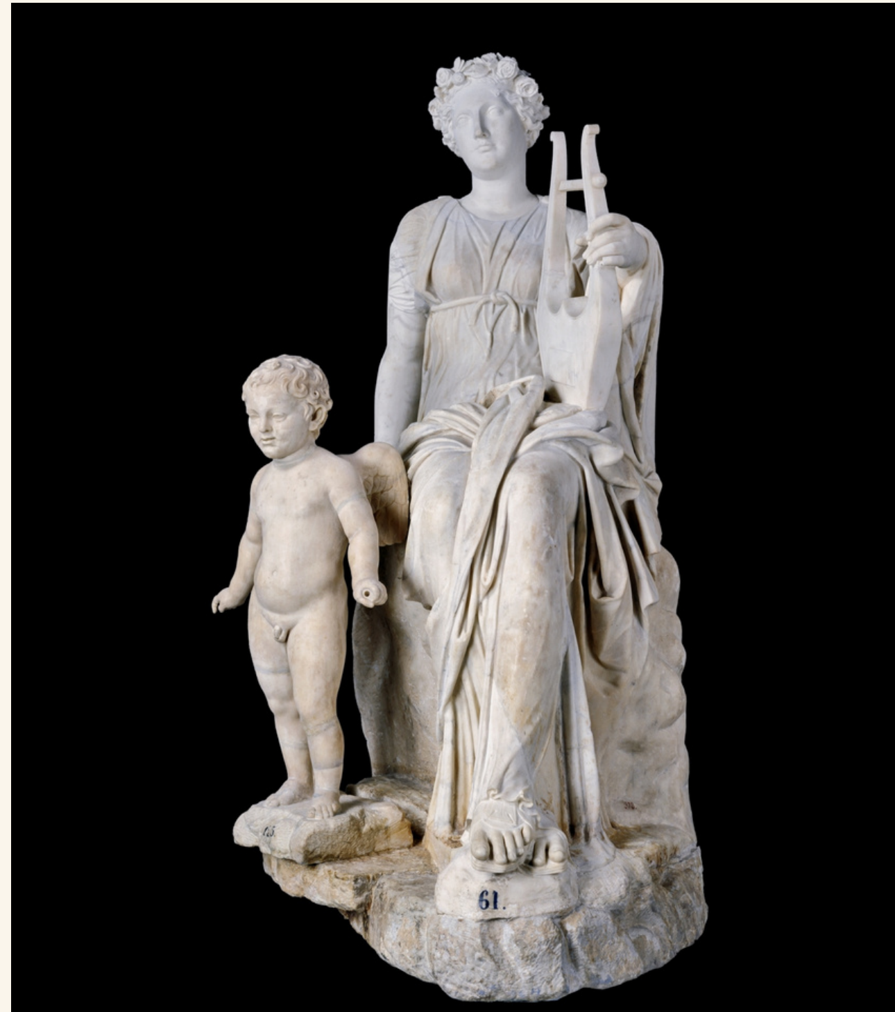
La musa Erato (en el Prado)