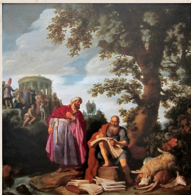
Hipócrates visita a Demócrito. Pieter Lastman siglo XVII. Óleo sobre tabla. Palacio de las Bellas Artes de Lille.

En la actualidad, vivimos una época de pleno debate entre la eutanasia y el aborto. Prima mucho el elemento moral en el debate entre lo ético de dichas prácticas, de la misma manera que la moralidad en sí era fundamental en época de Hipócrates. Ahora bien, ¿resulta contradictorio que se lleven a cabo dichas prácticas, si los mismos médicos deben realizar de manera obligatoria el juramento hipocrático? El debate está servido y no se prevé una situación diferente en los próximos años. Nos debemos apoyar, por tanto, en Hipócrates: sin moral ni ética no debe haber práctica.