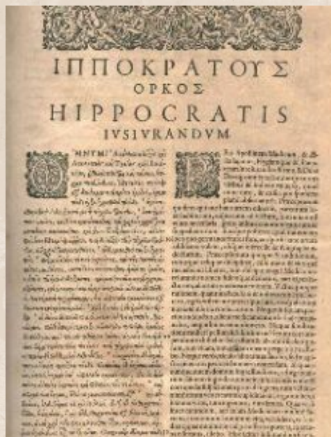
Versión latina de Hipócrates. Opera Omnia. Edic. de Radicius. Venecia, 1736. Tomo I.

Nos hallamos ante el tratado más breve, además del máximo exponente de la ética profesional del propio médico, incluso hasta nuestros días. Se trata, en suma, de un compromiso ético y profesional de un médico en ciernes, quien jura ante los dioses guardar el secreto profesional y no administrar productos letales a sus pacientes, además de no facilitar el aborto a las mujeres. Vemos, además, una gran carga moral en el tratado hipocrático: el médico es profesional, pero, ante todo, un ser humano.