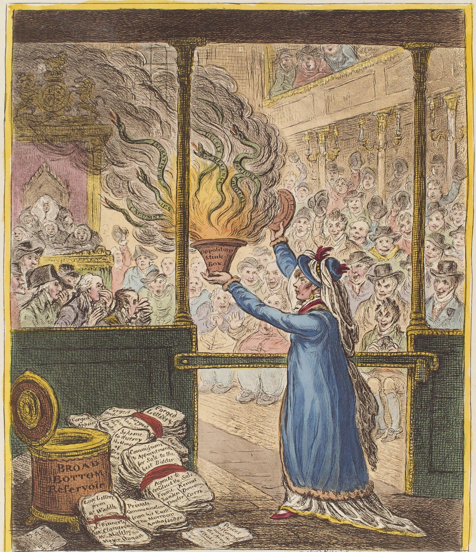
PANDORA opening her Box!