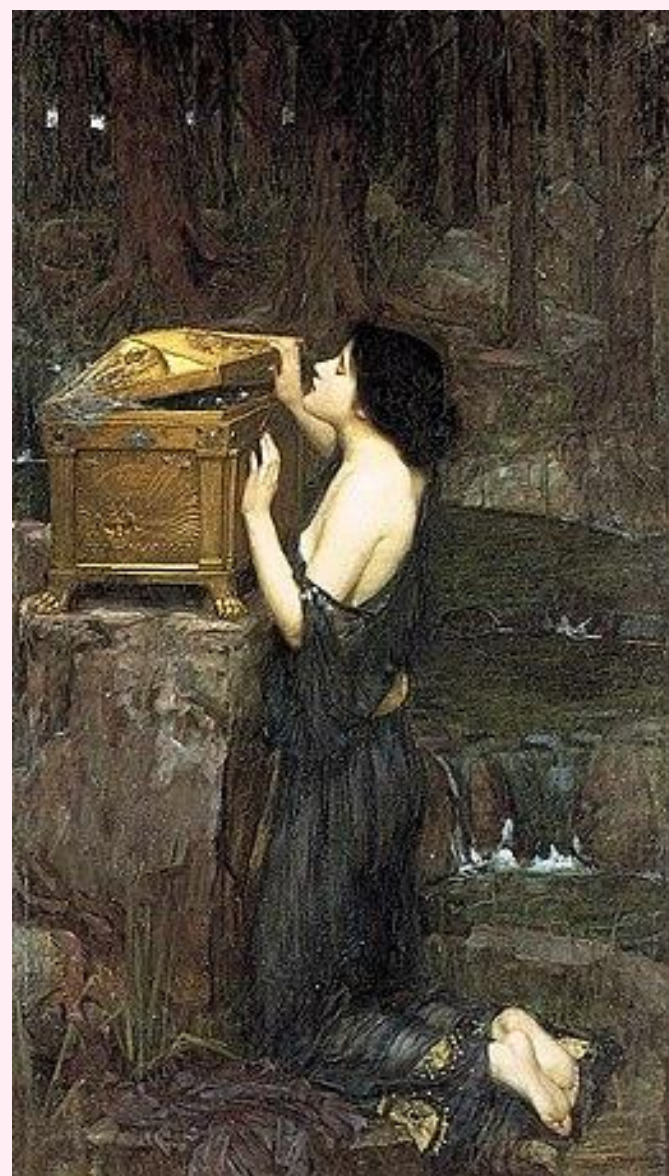
"Pandora" de John William Waterhouse, 1896

Se observan similitudes con pasajes del Génesis. Pandora ha sido tradicionalmente asociada a la figura de Eva. Ambas son mujeres "hechas" y no engendradas. De este modo, pervive la idea de la superioridad masculina frente a la femenina. Eva incita a Adán a probar la fruta del árbol prohibido. Ambas comparten la misma característica: buscan acceder al conocimiento mediante la desobediencia. Se tiente a que incumplan la norma, pero si la incumplen pueden acceder al conocimiento.