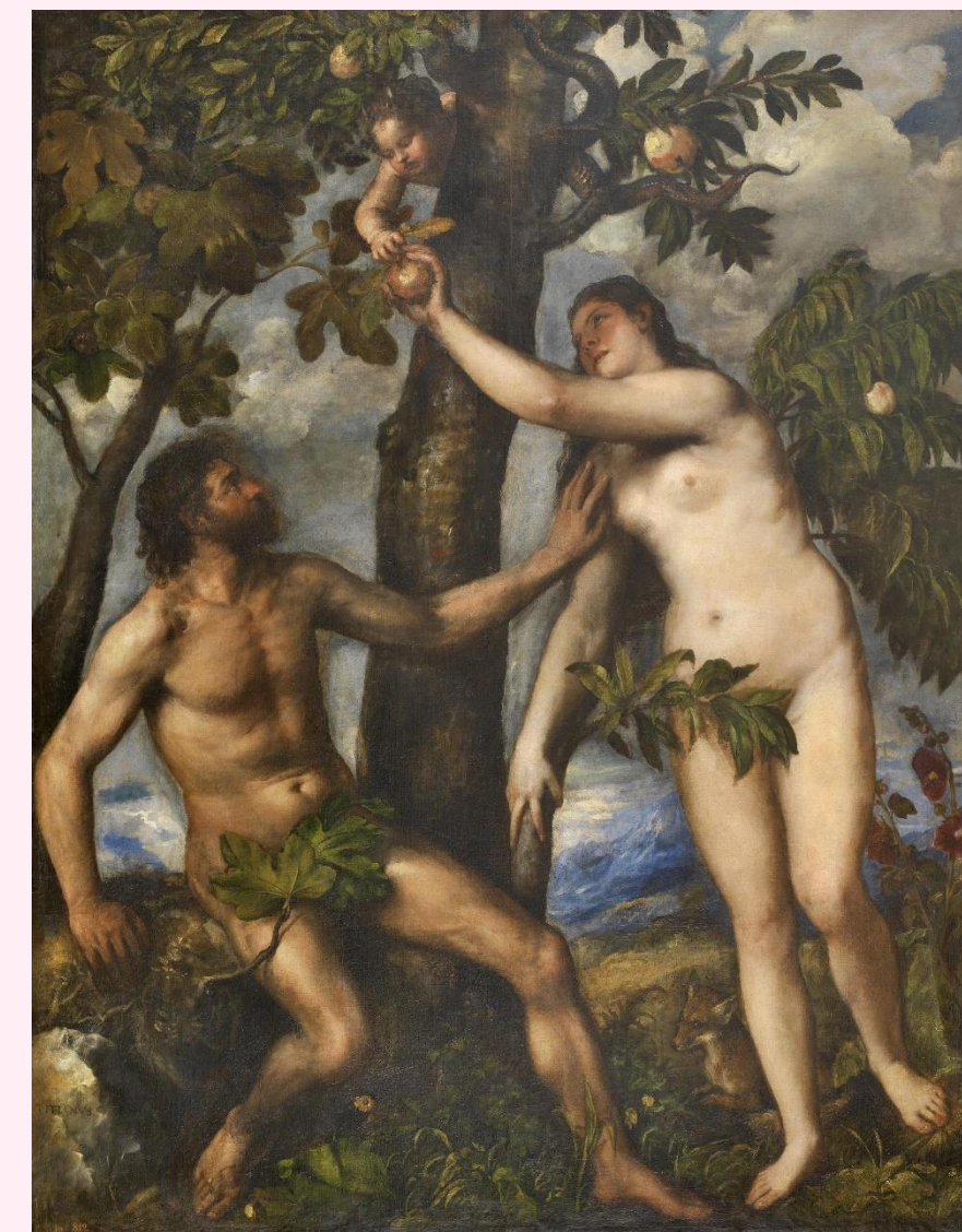
"Adán y Eva en el Paraíso Terrenal" de Tiziano, 1550

Se observan similitudes con pasajes del Génesis. Pandora ha sido tradicionalmente asociada a la figura de Eva. Ambas son mujeres "hechas" y no engendradas. De este modo, pervive la idea de la superioridad masculina frente a la femenina. Eva incita a Adán a probar la fruta del árbol prohibido. Ambas comparten la misma característica: buscan acceder al conocimiento mediante la desobediencia. Se tiente a que incumplan la norma, pero si la incumplen pueden acceder al conocimiento.