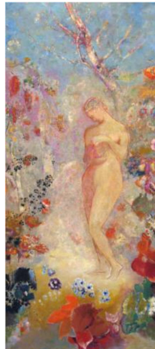
Pandora de Odilon Redon, 1910

Hay presencia de varios símbolos, la serpiente, que simboliza el demonio, causante del pecado, enredada en el brazo izquierdo, que alude al relato bíblico en el que engaña a Eva; la rama de manzana, símbolo de la fruta prohibida; la vasija ovalada de la que salieron las desgracias de la humanidad.